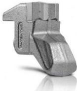
Teeth STC/3 STANDARD