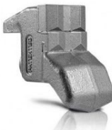
Teeth STC/3/HD OPTIONAL