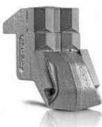
Teeth STC/3/FP OPTIONAL