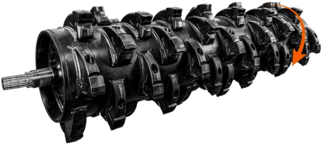
C/3/SS dx STANDARD